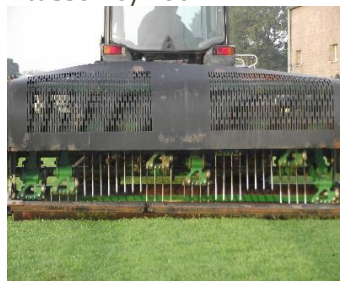
Verti drain tussen 0/40cm