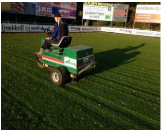
Ryan tussen 0/10cm

Doormiddel van een bezandingswagen schrale aarde, of wit zand, of indien nodig Field repair, boven op het terrein aanbrengen om alle oneffenheden en putten gelijk te slepen met een sleepmat. Dit resulteert in een mooi egaal terrein.